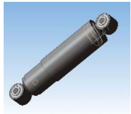
На предприятии используются современные методы разработки, в том числе компьютерное 3D-моделирование.