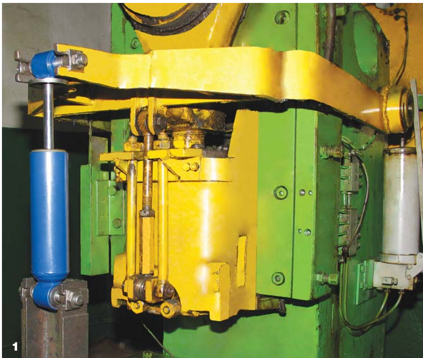
При разработке амортизатора К-ПАА ставится задача значительно превзойти показатели устойчивости к вспениванию и появлению течи, полученные при испытаниях зарубежных аналогов.