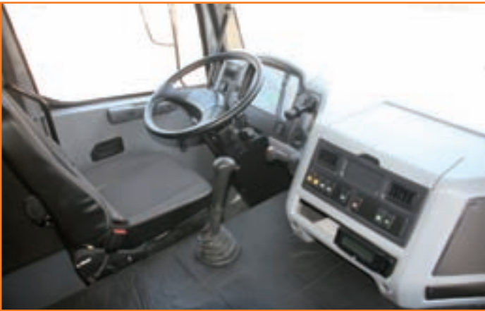
Интерьер кабины самосвала КрАЗ С20.0

Самосвальная платформа полукруглого сечения проектировалась с учетом самых современных в мировой практике конструкторских решений и отличается высокой прочностью.