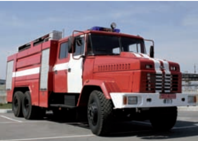
Новая пожарная автоцистерна АЦ-60 на шасси автомобиля КраЗ-65053. 2009 г.

шасси КраЗ-63221 (6x6), автомобиль комбинированного тушения АКТ-2/5 на шасси КраЗ-63221 (6x6), пиротехнические автомобили КраЗ-5233ВЕ и КраЗ-63221 и др.