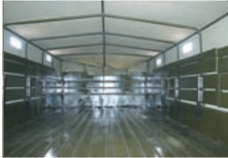
Платформа автомобиля КраЗ-7Э6316