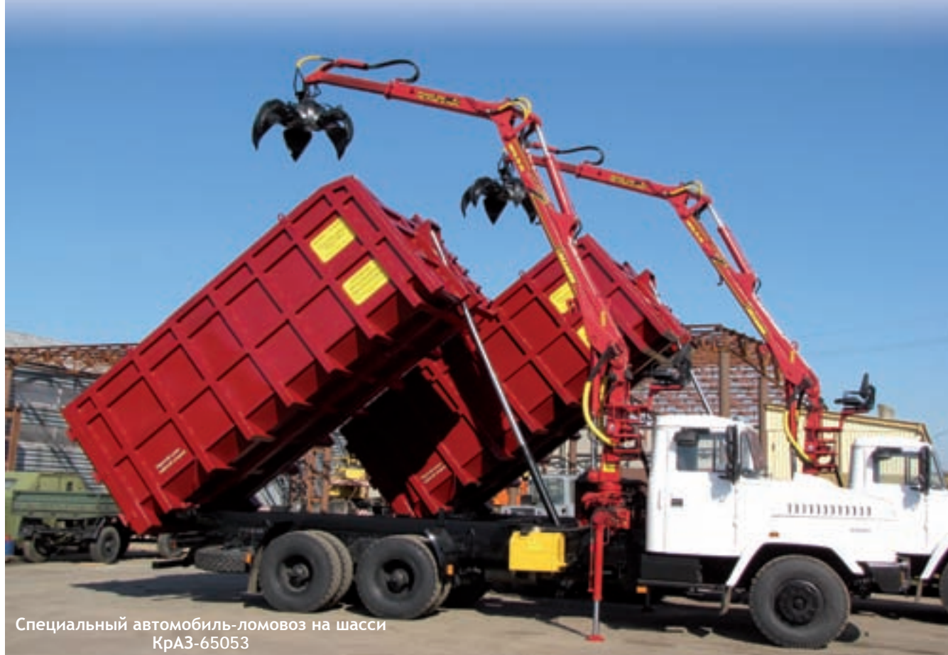
Специальный автомобиль-ломовоз на шасси КрАЗ-65053

Холдинговая компания «АвтоКрАЗ» проводит большую работу по расширению использования шасси автомобилей КрАЗ для новых видов современных надстроек. Одна из последних разработок — автомобиль-ломовоз на шасси КрАЗ-65053. Автомобиль имеет колёсную формулу 6х4. Он оснащён мощным двигателем ЯМЗ-238ДЕЗ (330 л.с.) с турбонаддувом.