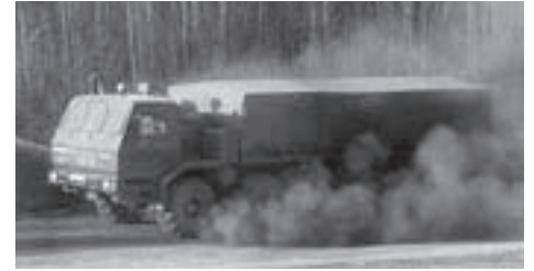
КрАЗ-6Э6316 «Сибирь» с имитацией навесной брони