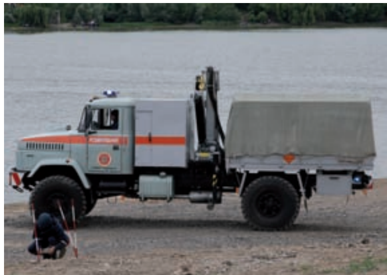
Пиротехнический автомобиль КраЗ-5233ВЕ на учениях МЧС "Днестр-2009" в Черновецкой области

Наиболее эффективным способом решения задач по ликвидации последствий чрезвычайных ситуаций является использование специальных машин и оборудования. Среди автомобилей, предназначенных для борьбы с чрезвычайными ситуациями, несут службу и кременчугские машины. Вот уже более полувека Кременчугский автомобильный завод выпускает специальные пожарные автомобили. За последние годы назначение этого типа автомобилей КраЗ и их технические возможности значительно расширились. Это пожарные автоцистерны АЦ-40 на шасси КраЗ-5233Н2(4х2), КраЗ-5233НЕ(4х2), АЦ-60 на шасси КраЗ-65053(6х4), аэродромный пожарный автомобиль АК-60 на