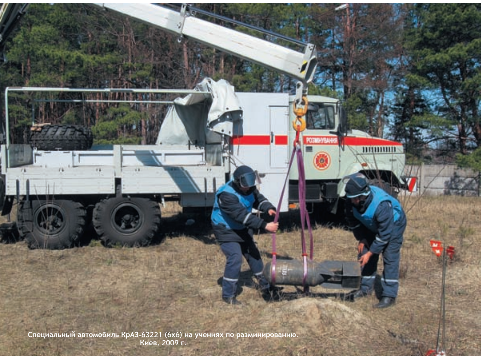
Специальный автомобиль КраЗ-63221 (6х6) на учениях по разминированию. Киев, 2009 г.