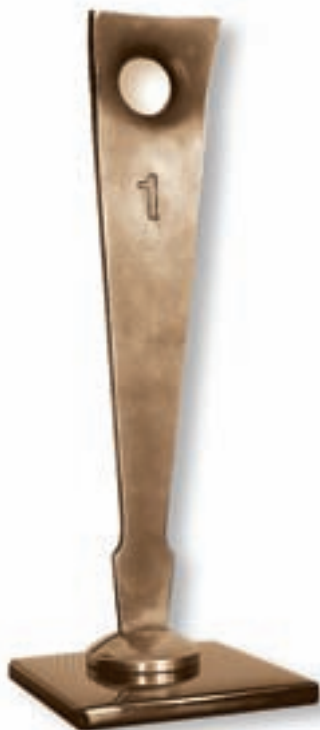
Кубок за самый креативный тюнинг чемпионата

Это подтвердилось позже, после подведения итогов. «Krazy-Crocodile» в конкурсе «Супер-тюнинг» занял первое место и был награждён призом как автомобиль с самым креативным тюнингом чемпионата.