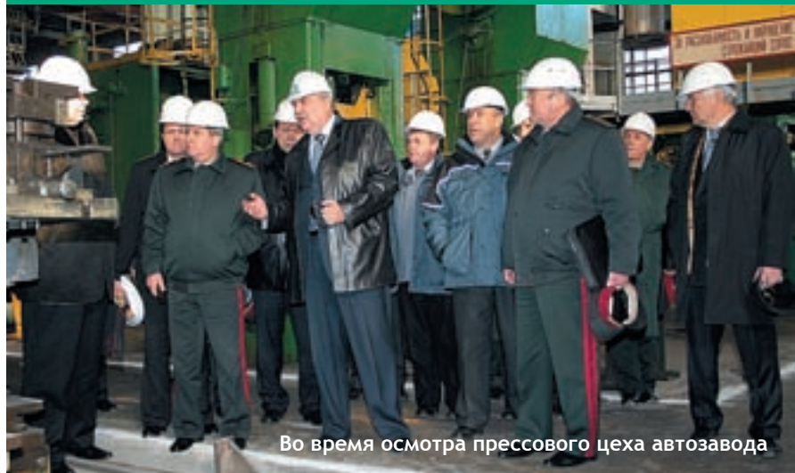
Во время осмотра прессового цеха автозавода

и в плане государственного заказа на 2009 год — более 1000 автомобилей КраЗ. Но и эта цифра не окончательна, исходя из того, что на Украине есть возможность выпускать автомобили, которые бы обеспечивали боеспособность Вооружённых Сил. Я думаю, тот заказ в 1000 автомобилей на следующий год — это только начало заказов, которые будут делать Вооружённые Силы «АвтоКраЗу». Очень радует то, что ожидания, которые есть в Генеральном штабе относительно Холдинговой Компании и автомобилей КраЗ для развития автомобильной составляющей вооружения национальной армии, подтвердились, и даже с большим запасом».