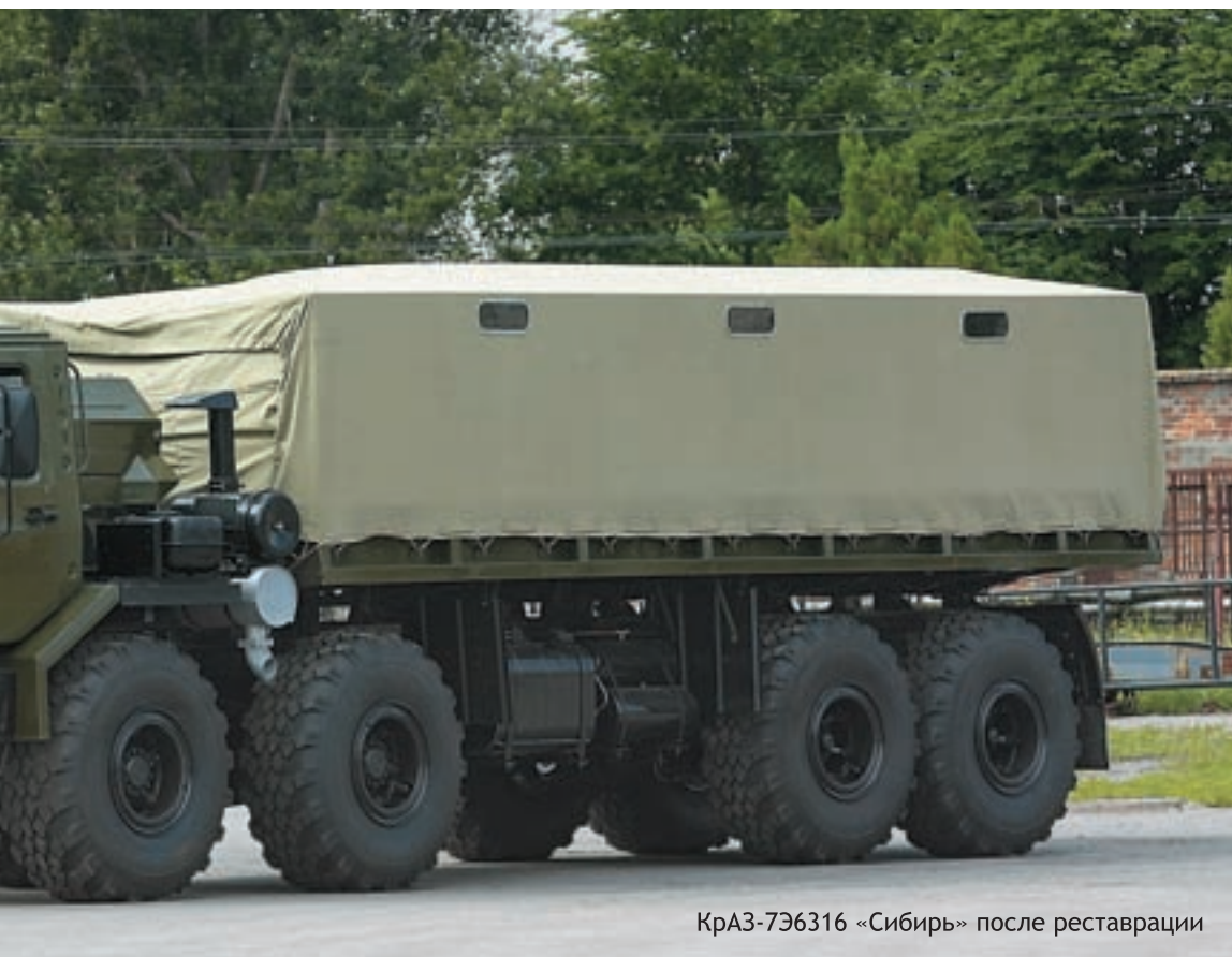
КраЗ-7Э6316 «Сибирь» после реставрации

Наибольшую сложность у реставраторов вызвал второй управляемый мост автомобиля оригинальной проходной конструкции. Дело осложнялось тем, что не вся конструкторская документация сохранилась по этому семейству. Все пыльники, сальники и прочие резинки на машине установили новые, как и сшитый заново тент на платформу. Объём проведённых восстановительных работ лучше всего демонстрируют фотографии.