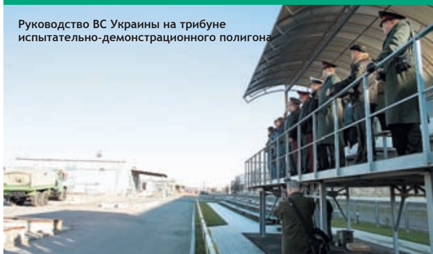
Руководство ВС Украины на трибуне испытательно-демонстрационного полигона