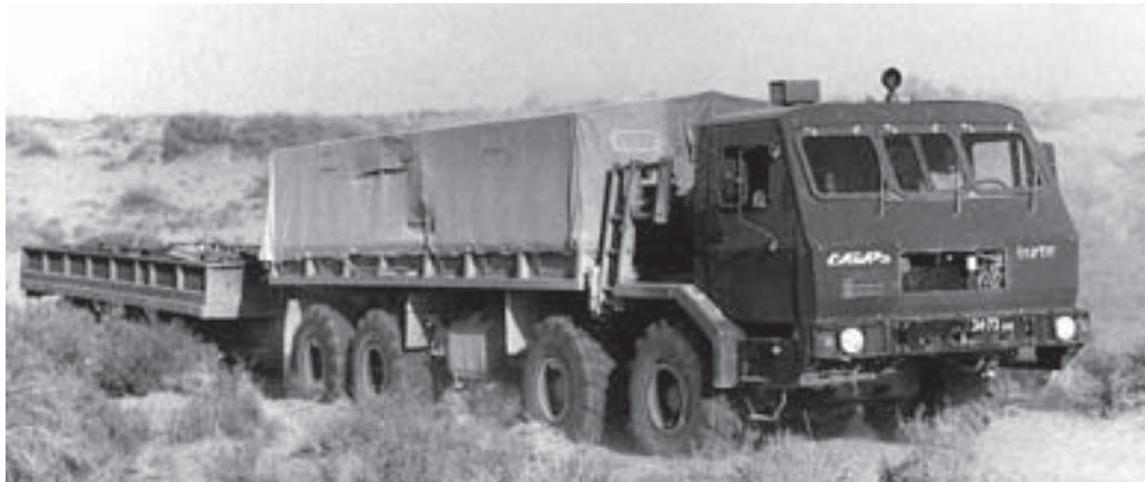
«Сибирь»: движение по пересеченной местности в составе автопоезда

КрАЗ-5Э63151 (6x6). Это обуславливалось необходимостью натуральных проверок решений конструкторов по новым требованиям МО к разрабатываемым автомобилям. В 1989 году на базе КрАЗ-6Э63161 на заводе создали новый образец КрАЗ-7Э6316 «Сибирь». От своего раннего варианта он отличался, в основном, оригинальным радиатором системы охлаждения, который теперь располагался горизонтально над двигателем и имел