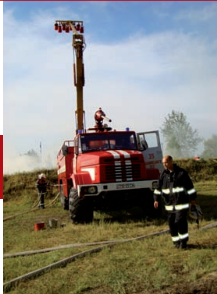
Автомобиль КраЗ-63221 с оборудованием для комбинированного тушения пожаров на учениях МЧС в Полтавской области. 2008 г.

Как носители целого ряда аварийно-спасательных комплексов, КраЗы остаются вне конкуренции. Высокие качества пожарной спецтехники на шасси КраЗ были продемонстрированы на учениях МЧС в 2008 году, проводившихся в Полтавской области, и в Черновицкой области на учениях "Днестр-2009".