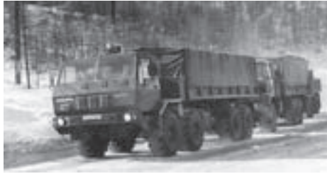
КрАЗ-6Э6316 буксирует бортовой КрАЗ-5Э63151

После завершения приёмочных испытаний в декабре 1988 года все опытные образцы КрАЗ-6315 , КрАЗ-6316 и КрАЗ-6010 по решению ГЛАВТУ МО СССР были отправлены в НИИ-21 в Бронницах. Автозаводу оставили всего две машины: КрАЗ-6Э63161 (8x8) и