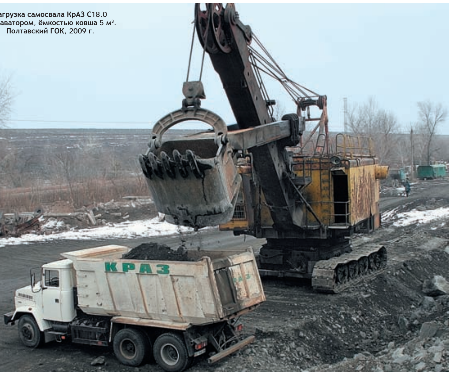
Загрузка самосвала КрАЗ С18.0 экскаватором, ёмкостью ковша 5 м 3 . Полтавский ГОК, 2009 г.

лёгкий в управлении, эффективнее и экономичнее, выносливее и надёжнее своих зарубежных аналогов, в частности, китайских автомобилей, с которыми новый самосвал и проходил сравнительные испытания. Самосвал «Горняк» — отличная машина. Уверен, что у него хорошее будущее».