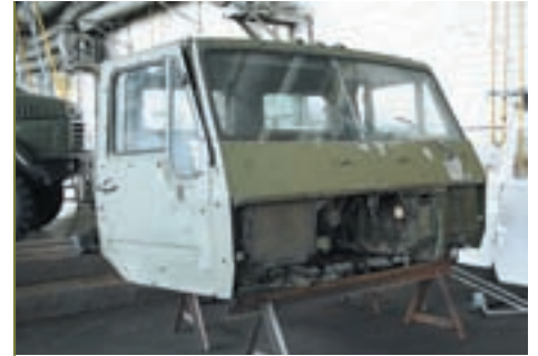
Кабина КраЗ-636316 во время реставрации в экспериментальном цехе Кременчугского автозавода

нового руководства многие отнеслись доброжелательно, и не только заводчане.